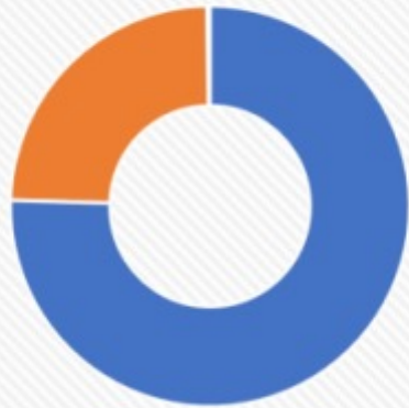
RAMING INKOMSTEN 2023