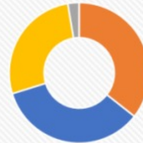
RAMING UITGAVEN 2023